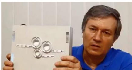
Grigori Petrovich Grabovoï, mars 2020

https://www.youtube.com/watch?v=bhaqfta6WUQ&feature=youtu.be